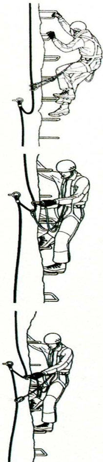
Progressione su ferrata